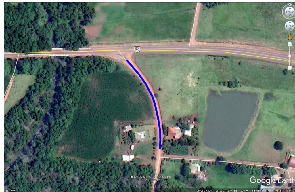
Imagem Satélite Localização